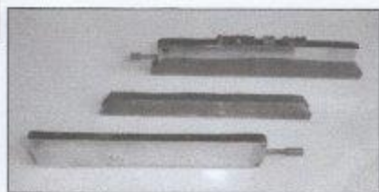
COMPOSTEURS ET PORTE-COMPOSTEURS