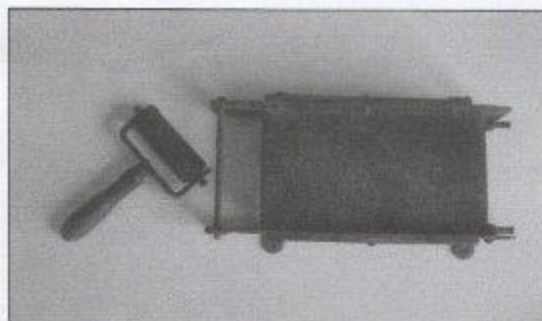
PRESSE ET ROULEAU ENCREUR